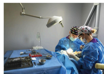
Le Bloc Opératoire

La radio 3D en interne permet d'avoir un diagnostic immédiat