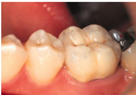
Scellement en bouche et résultat final.